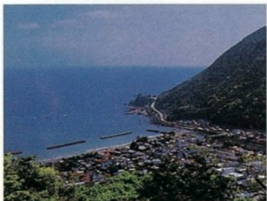
城山下の休憩舎より河津方面を望む